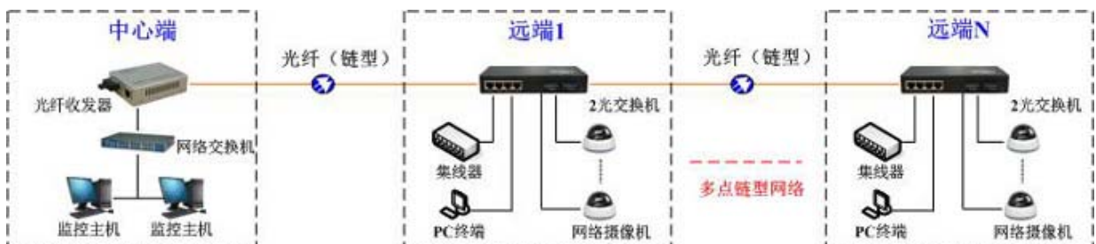
方案一：光纤多点组链型网络